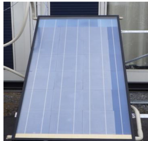
『SUFA』を用いた太陽光集熱パネル